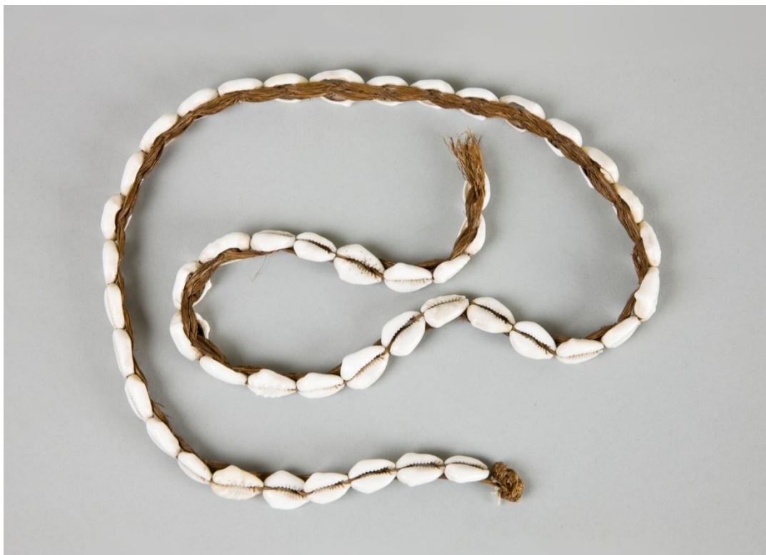
Sznur z muszlami kauri ( Cypraea moneta )